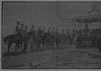
Una sección de caballería del ejército regular