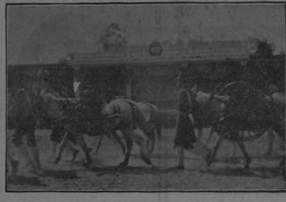
Una sección de artillería del ejército regular